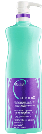
REHABILIT8 Συσκευασία 1 λίτρου

Λούστε (συνιστάται το κατάλληλο Σαμπουάν από την σειρά της Malibu C ) και ξεβγάλτε, μετά απλώςτε Rehabilit8 Protein ή/και ένα εξατομικευμένο Concentr8 Mixer κοκτέιλ από την επαγγελματική σειρά της Malibu C παντού στα μαλλιά. Αφήστε σε θερμοκρασία δωματίου το λιγότερο για 2 λεπτά, μετά ξεβγάλτε. Για πιο εντατική θεραπεία, μπορεί να γίνει χρήση θερμότητας.