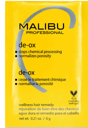
DE-OX Συσκευασία Φακελάκι 6g

Γεμίστε το απλικατέρ με 60 ml ζεστό νερό και αδειάστε τους κρυστάλλους. Ανακινήστε καλά για να διαλυθούν. Προσθέστε 180 ml ζεστό νερό και στη συνέχεια ανακινήστε για να σχηματίσετε ένα ελαφρύ τζέλ. Απλώστε σε οξειδωμένα μαλλιά απο τεχνικές εργασίες για να σταματήσετε την οξειδωτική δράση του οξυζενέ και του ντεκαπάζ. Ξεβγάλτε το De-Ox από τα μαλλιά και στη συνέχεια χρησιμοποιήστε σαμπουάν /conditioner όπως απαιτείται.