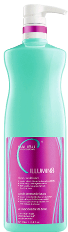
ILLUMIN8 SHINE Συσκευασία 1 λίτρου