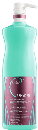
REHYDR8 Συσκευασία 1 λίτρο