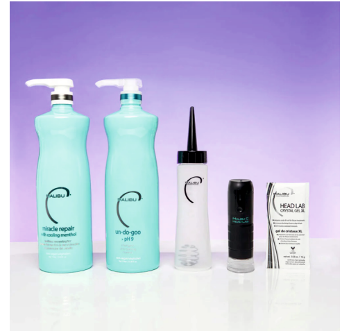
HEAD LAB® INTRO